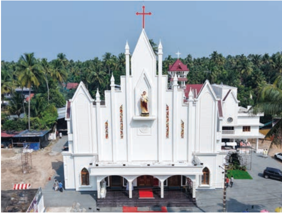
2025 നവംബർ 16ന് ആശീർവദിക്കപ്പെട്ട മണലൂർ വെസ്റ്റ് ഇടവക പള്ളിയുടെ മുഖവാരവും, മദ്ബഹയും