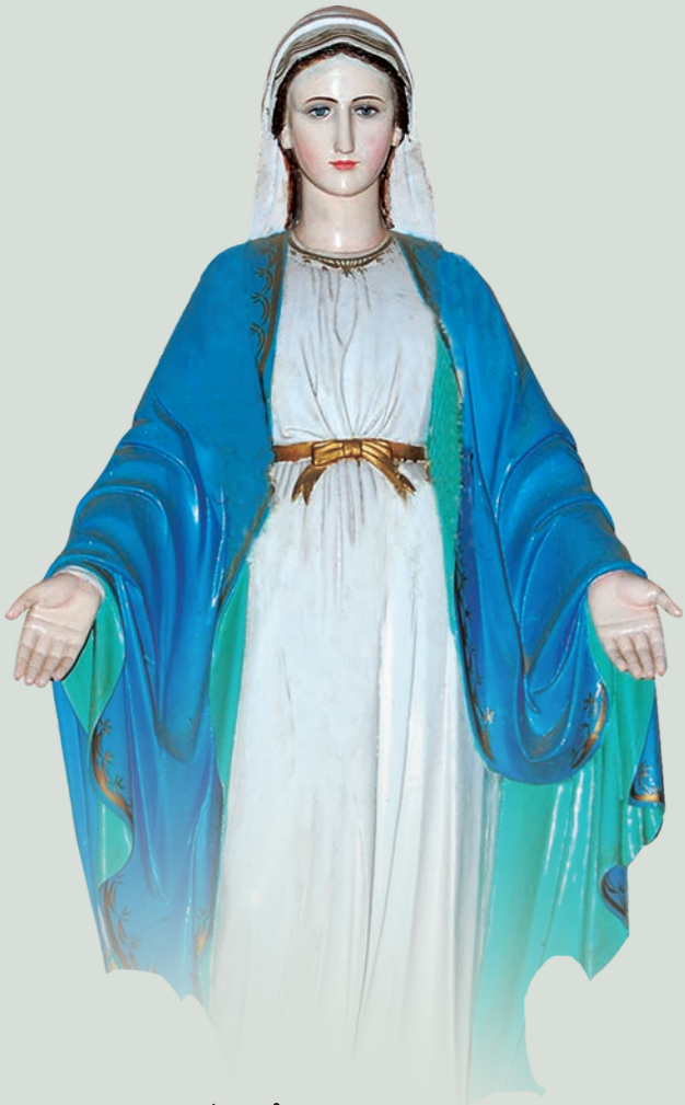
തൃശ്ശൂർ അതിരൂപതയുടെ മദ്ധ്യസ്ഥയായ പരിശുദ്ധ അലോത്താവിന്റെ തിരുനാൾ മംഗളങ്ങൾ ഡിസംബർ 08