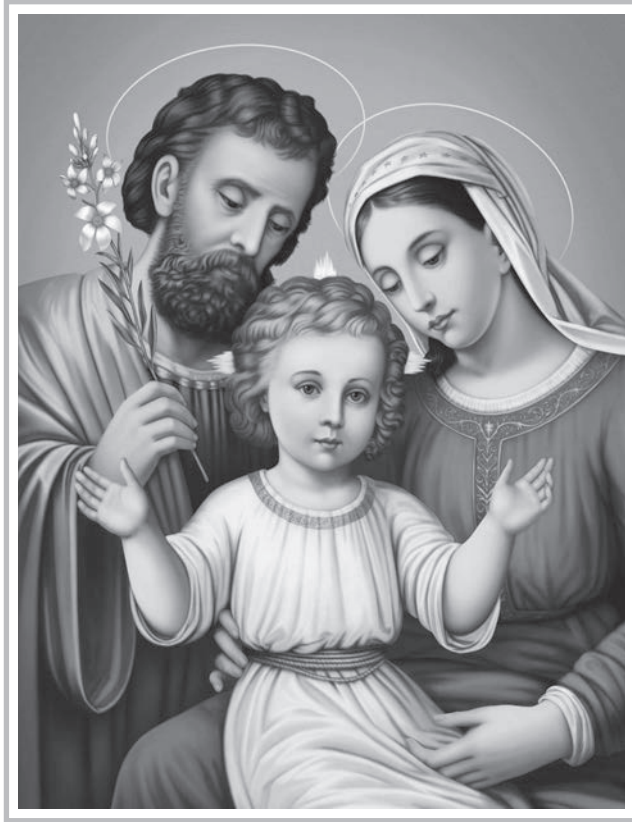
The Holy Family of Jesus, Mary and Joseph December 28, 2025