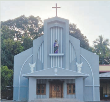
പങ്ങാടിയിൽ ഇടവക പള്ളിയുടെ നവീകരിച്ച മുഖവാരം